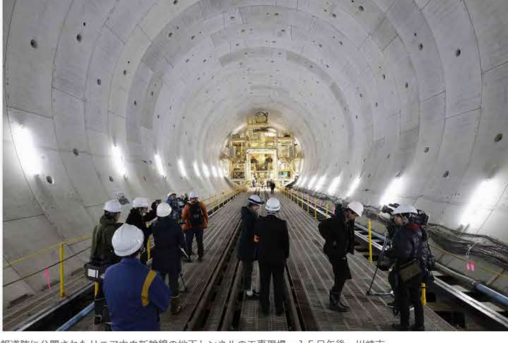
報道陣に公開されたリニア中央新幹線の地下トンネルの工事現場＝15日午後、川崎市