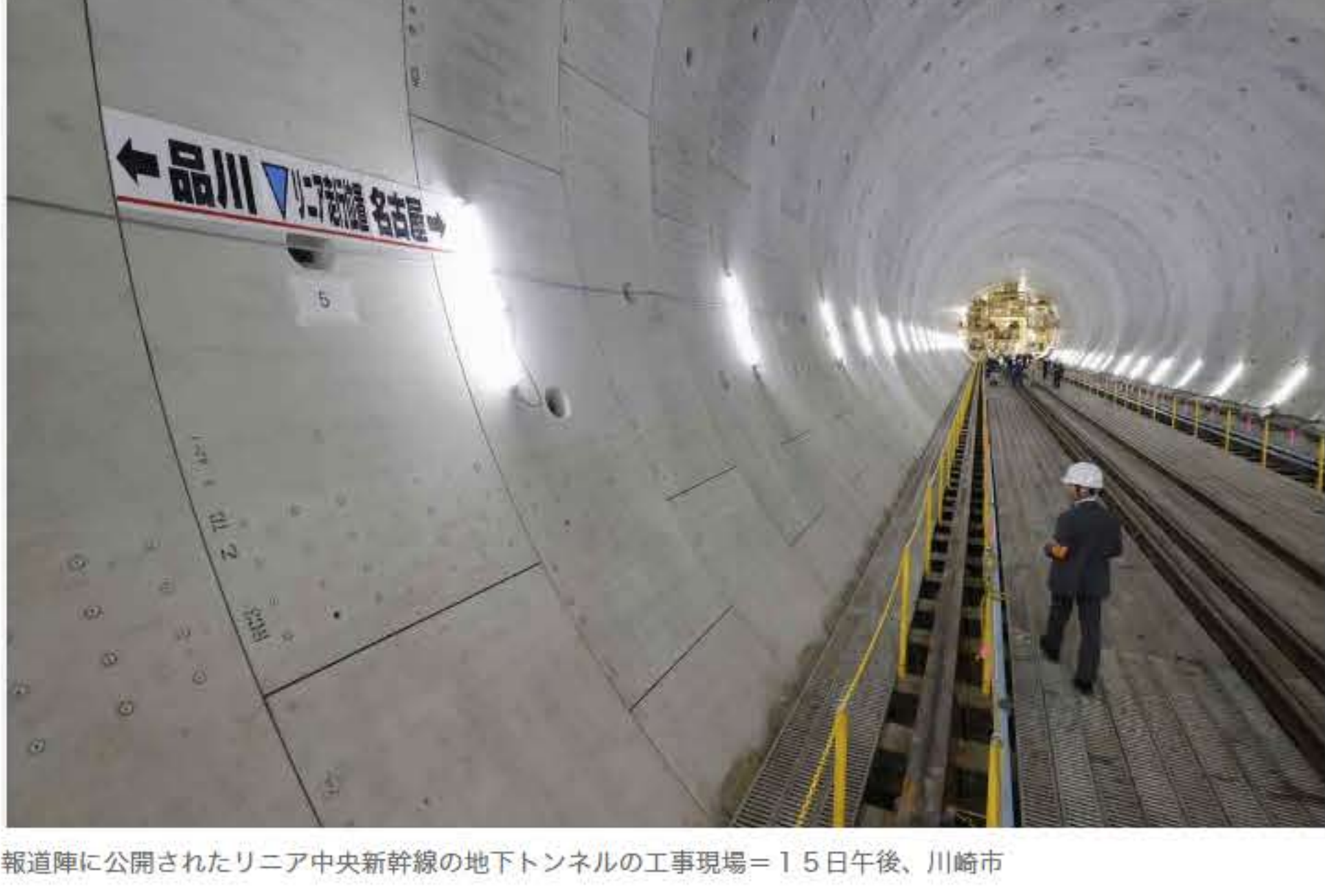
報道陣に公開されたリニア中央新幹線の地下トンネルの工事現場＝15日午後、川崎市