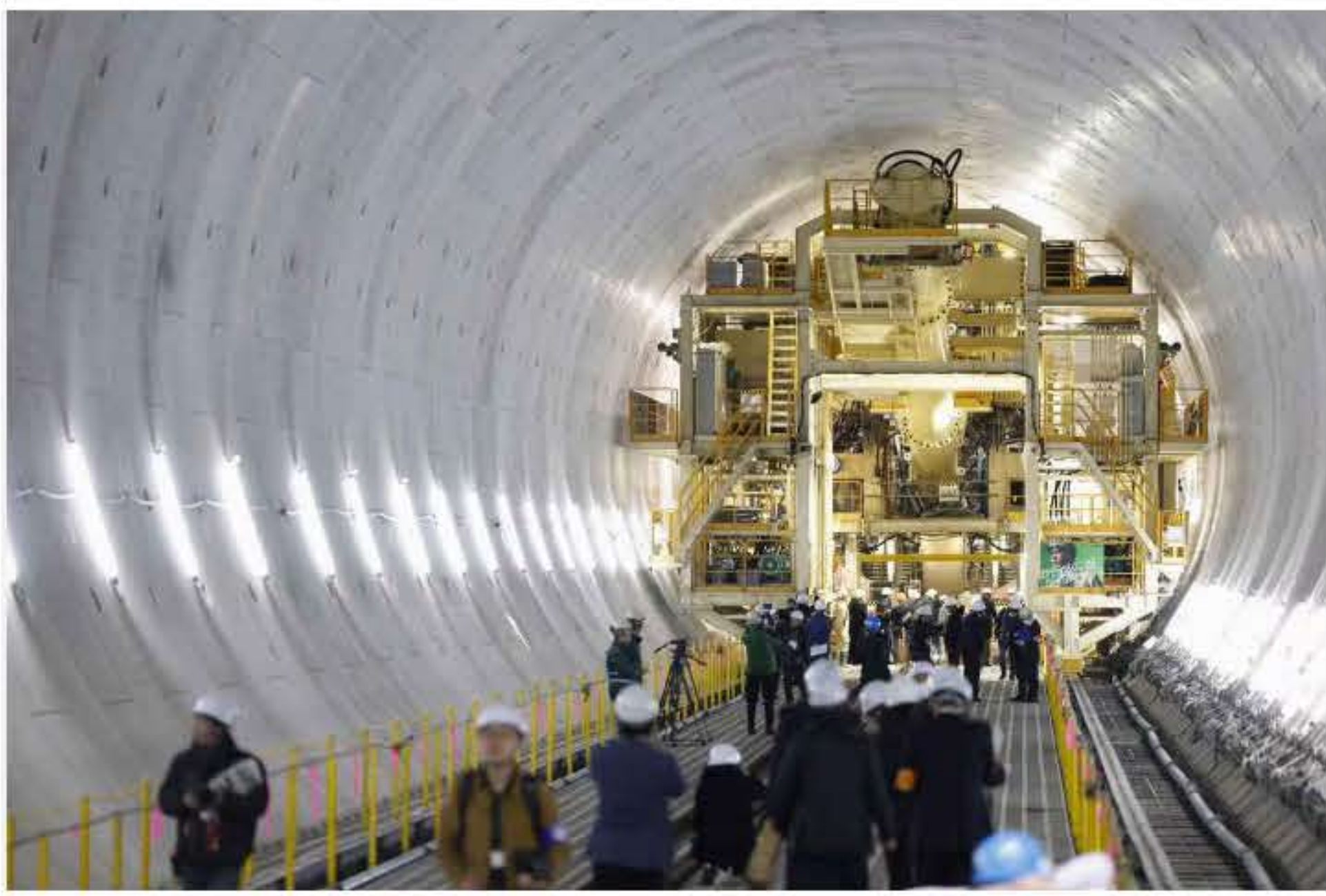
報道陣に公開されたリニア中央新幹線の地下トンネルの工事現場＝15日午後、川崎市

JR東海は15日、川崎市にあるリニア中央新幹線の東百合丘工区で、地下トンネルの工事現場を報道陣に公開した。現在は大型掘削機「シールドマシン」による調査掘進を終えた段階で、本格的な掘進を今年9月ごろ始めるために準備を進めている。