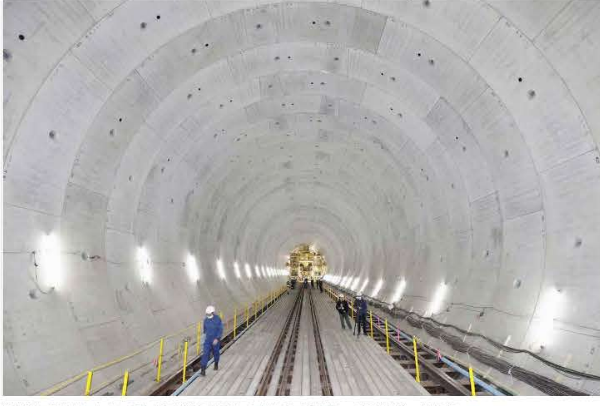
報道陣に公開されたリニア中央新幹線の地下トンネルの工事現場＝15日午後、川崎市

リニアは静岡県の反対で一部区間の工事に着手する見通しが立たず、2027年の開業が困難になっている。