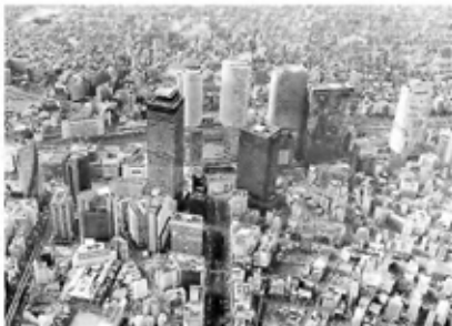
2021年のJR名古屋駅周辺。高層ビルが林立している—本社へりから

それまで名古屋の中心は、徳川家康が築いた名古屋城の城下町として発展した栄地区だった。今、勢いは駅前が上回る。名古屋市内の商業地の公示地価をみれば明らかだ。22年1月1日時点、1平方メートルあたりで名古屋駅周辺の中村区2470万円に対し、栄地区のある中区は180万円。08年に名古屋市の最高価格地点を中区が中村区に譲ると、差は広がっていった。百貨店の売上高をみても、15年に名古屋高島屋の売上高が、栄地区で400年の伝統を誇る松坂屋名古屋店を上回った。