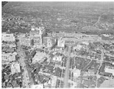
1959年の名古屋駅—本社横から

JR東海が50・2%を出資し、高島屋と共同で運営する名古屋高島屋はバレンタイン期には関連商品を約30億円売り上げ、全国の百貨店の中でも最大級の販売実績を誇る。2001年から全国に先駆けて大規模なバレンタイン催事を始め、東名管会長は当時、「経営多角化の切り札」と述べた。